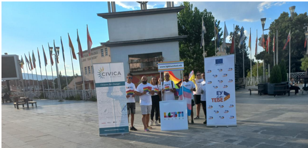
Информативен штанд во Струмица

така беа поделени околу 500 флаери со основни информации за здружението и информации за основните поими кои ЛГБТИ заедницата ги користи.