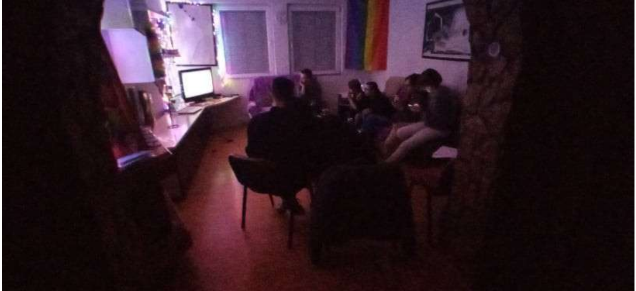
Филмска вечер во Центарот на ЛГБТИ заедницата во Тетово

истовремено во една просторија. Во Центарот секоја недела беа реализирани различни активности за ЛГБТИ лицата како што се: филмски вечери, дискусии и различни работилници.