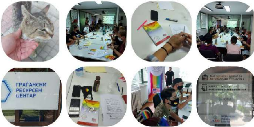
Фотографии од првата обука на тема „ЛГБТИ правата во Северна Македонија и креативен активизам“

Учесниците на овие обуки се запознаа со тоа кои се задачите на Комисијата за заштита од дискриминација. Примерок од формуларот за поднесување на претставка до Комисија за заштита од дискриминација им се подели на сите учесници, и тие имаа можност со помош на обучувачот да го потполнат и на тој начин во практика да научат како се потполнуваат претставките.