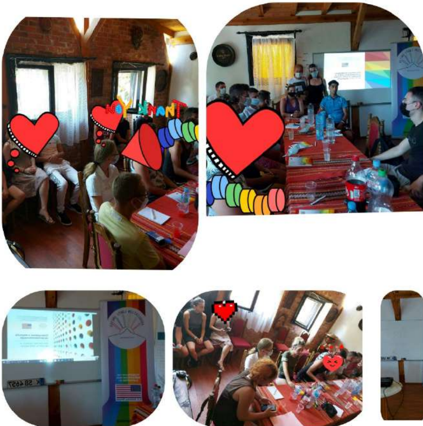
Фотографи од втората и третата обука на тема „ЛГБТИ правата во Северна Македонија и креативен активизам“

Проект: „Итен одговор и помош за ЛГБТИ заедницата во Северна Македонија“