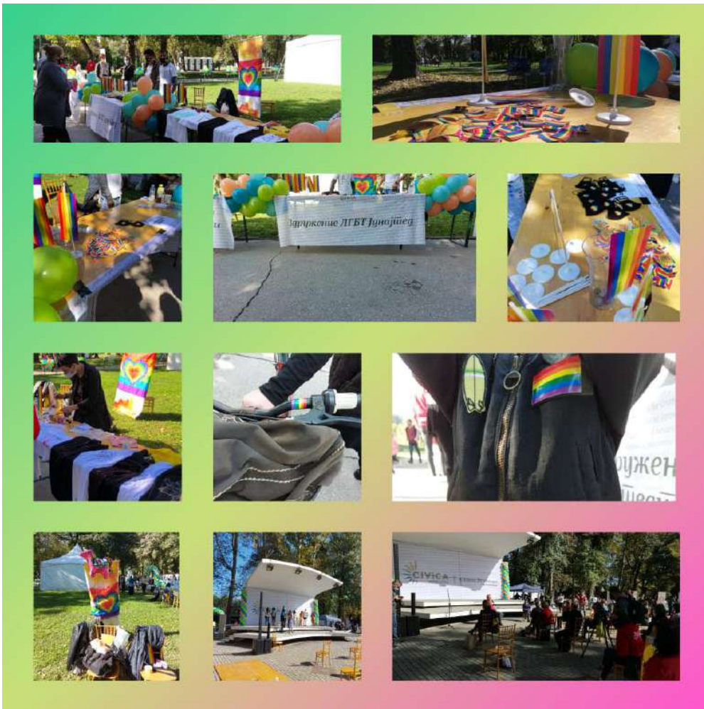
Фотографија од учеството на денот на невладините организации организиран од Цивика Мобилитас

ЛГБТ Јунајтед Тетово во склоп на овој проект реализираше различни обуки и работилници за зајакнување на капацитетите на својот персонал и волонтерите, како и обуки наменети за зајакнување на ЛГБТИ заедницата. Неколку од обуките кои ги реализиравме во 2020 година се: Работилница за подобрување на комуникацијата во работата на ЛГБТ Јунајтед Тетово, Работилница за идентификување на потребите од обука на ЛГБТИ заедницата, Работилница пишување на предлог проекти наменета за припадници на ЛГБТИ заедницата.